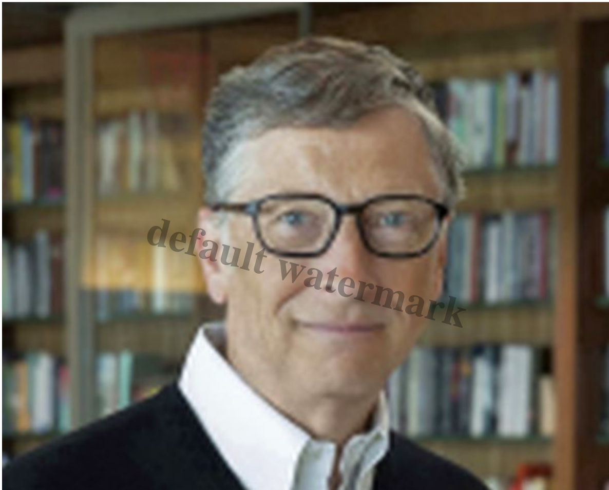
Bill Gates (1955- )

Doel: een vaccin voor alle ruim 7 miljard aardbewoners. Maar is hij echt een filantroop? Of heeft hij een verborgen agenda?