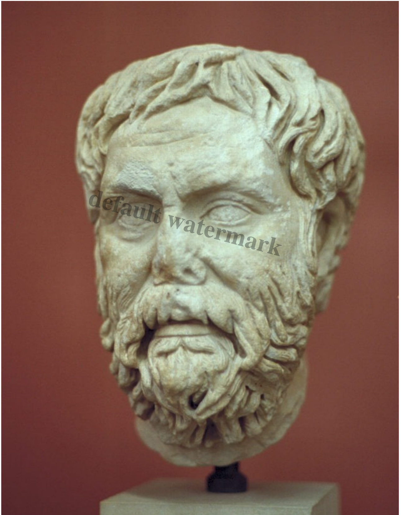
Pyrrho (Ca. 360 - 270 v.Chr.)