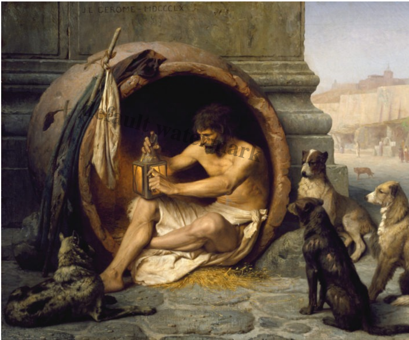
Diogenes (404 v.Chr. - 323 v.Chr.)

Een cynicus zegt: "Je hebt veel minder nodig dan je denkt."